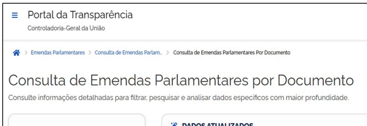
Portal da Transparência – Controladoria-Geral da União

O empenho fica registrado na chamada “nota de empenho”, que indicará o nome do credor, a especificação e a importância da despesa, bem como os demais dados necessários ao controle da execução orçamentária. No Portal da Transparência da CGU, inclusive, existe a possibilidade de pesquisar informações sobre emendas parlamentares a partir do número de uma nota de empenho, vide link Consulta de Emendas Parlamentares por Documento .