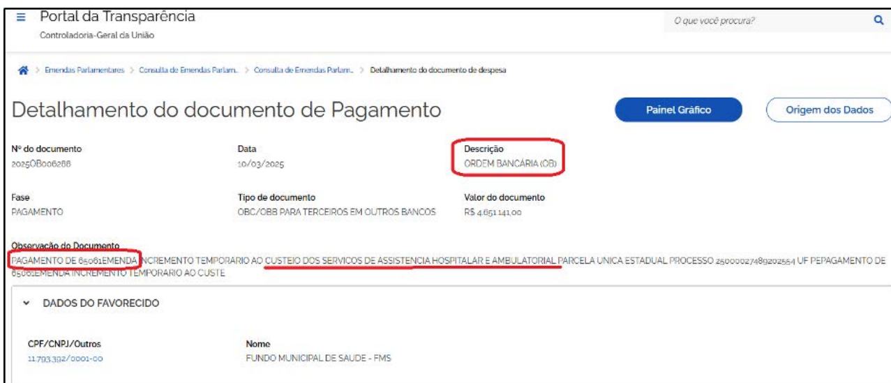
Portal da Transparência – Controladoria-Geral da União

A importância disso para emendas parlamentares é significativa. A ordem bancária está disponível em portais de transparência, que trazem informações relevantes acerca de cada uma das emendas, como o nome e o CNPJ daquele que será favorecido pelo pagamento da emenda. No Portal da Transparência da CGU, por exemplo, existe a possibilidade de pesquisar informações sobre emendas parlamentares a partir do número da ordem bancária ( Consulta de Emendas Parlamentares por Documento ).